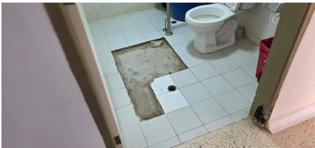
Ilustración 9. Condiciones de Enchape en Baños.

Las actividades del componente son Enchape de piso en baños, garantizando la correcta nivelación de la superficie, aplicación de adhesivo adecuado, instalación precisa de las piezas, alineación uniforme, emboquillado sellado y entrega del área completamente limpia y funcional. Escarificación y pintura, incluyendo estuco, exigiendo la preparación completa de la superficie, retiro de pintura suelta, aplicación de estuco para alisar, lijado fino, imprimación cuando sea necesario y aplicación de pintura en capas uniformes, asegurando un acabado continuo y de alta calidad.