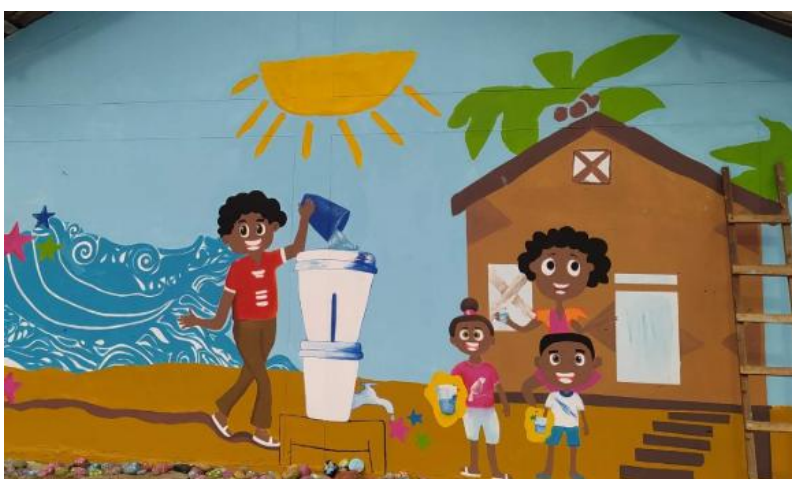
Ilustración 14. Murales con mensajes claves (imagen de referencia)

Las actividades correspondientes al componente otros incluyen la instalación de mural con mensajes clave sobre el lavado de manos en el área de la alberca o punto designado, con el fin de promover prácticas de higiene adecuadas entre usuarios y personal del centro de salud. Revisar el tablero eléctrico, corregir las fallas, cambio de breakers, organización y rotulación de circuitos, ajuste de conexiones y pruebas de funcionamiento según RETIE. También comprenden la instalación de señalética informativa y de orientación, elaborada con materiales resistentes y de fácil lectura, que contribuye a la organización y seguridad de los espacios. Finalmente, se contempla la ejecución de labores de aseo y limpieza general posteriores a las intervenciones, garantizando la correcta presentación, salubridad y funcionalidad de todas las áreas intervenidas.