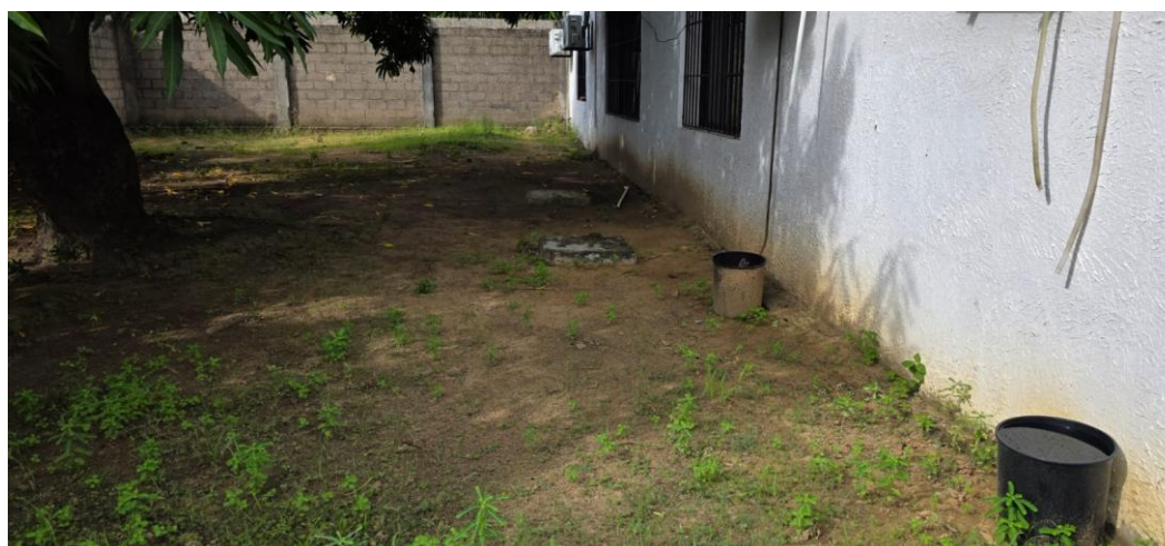
Ilustración 4. Cajas sanitarias

Se deberá realizar el Sondeo de tuberías existentes de agua tratada y alcantarillado, exigiendo inspección completa, detección de obstrucciones, limpieza interna, verificación de continuidad, registro fotográfico y certificación del estado final. Reparación e impermeabilización de alberca, garantizando la corrección de fisuras, aplicación de mortero o resane según necesidad, colocación de sistema impermeabilizante especializado, pruebas de estanqueidad y entrega sin filtraciones. Retiro de sanitario adulto, asegurando el cierre previo del suministro, desmontaje sin causar daños a las conexiones, sellado temporal del desagüe, limpieza del área intervenida y adecuada disposición del elemento retirado. Desmonte, desinfección y montaje de tanque elevado de 500 litros, exigiendo desmontaje seguro, lavado y desinfección interna con productos certificados, revisión de soportes, reinstalación firme, reconexión de tuberías y prueba de llenado sin fugas.