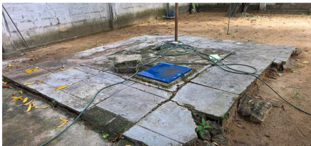
Ilustración 5. Alberca Antigua (levante 1,5 metros de altura)

Los trabajos comprendidos en este apartado incluyen el enchape de alberca, garantizando preparación adecuada de la superficie, aplicación de adhesivo especializado, colocación alineada de las piezas, emboquillado impermeable y entrega totalmente sellada y libre de filtraciones. Levante de muro para caseta de herramientas de aseo, exigiendo replanteo correcto, mampostería nivelada, plomos verificados, juntas uniformes y acabado listo para recibir pintura. Levante de muro para realce de alberca (1,5 m) incluyendo 4 columnas, garantizando cimentación adecuada, armado y fundida de columnas según especificación, alineación vertical, refuerzo correcto y estabilidad estructural. Placa en concreto reforzado 3000 psi para alberca, espesor 10 cm, incluyendo formaleta, exigiendo acero de refuerzo conforme al diseño, mezcla controlada, vibrado adecuado, nivelación y curado del concreto. Placa en concreto reforzado 3000 psi para piso de caseta de herramientas de aseo, asegurando compactación del terreno, colocación de malla o refuerzo, vertido uniforme, acabado adecuado y curado correcto. Escarificación y pintura, incluyendo estuco, exigiendo retiro de pintura suelta, corrección de imperfecciones, aplicación de estuco para alisar, lijado fino, imprimación cuando sea requerida y pintura en capas uniformes con acabado de alta calidad.