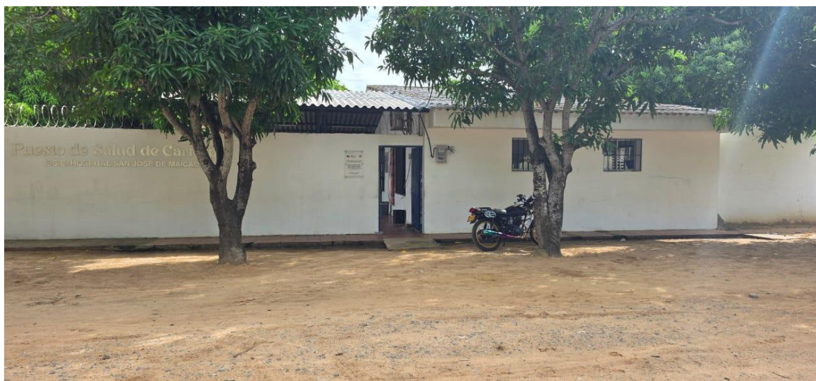
Ilustración 1. Vista Frontal Puesto de Carreipia – Maicao

La E.S.E. Hospital Santa Teresa de Jesús de Ávila se encuentra ubicado en el municipio de Dibulla, La Guajira, en las coordenadas Latitud 11.270698 – Longitud -73.303104. El acceso vial es pavimentado y en buen estado, ubicado a 58 minutos del casco urbano de Riohacha, lo que permite fácil desplazamiento de usuarios, emergencias y personal asistencial.