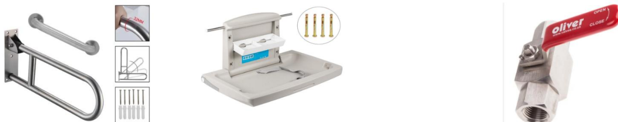
Ilustración 13. Accesorios

funcionalidad, durabilidad y facilidad de limpieza. Finalmente, contempla el suministro e instalación de cambiador de bebés abatible, asegurando su correcta fijación y estabilidad, en cumplimiento de los estándares de higiene y confort en centros de salud. Suministro e Instalación de dispensador de agua con conexión eléctrica. (Tren triple de filtración + UV Desinfección). Suministrar e instalar llave de paso 1/2" en acero antitráfico, incluyendo conexiones y pruebas de funcionamiento.