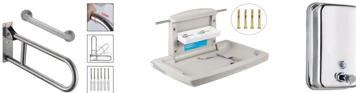
Ilustración 7. Accesorios a instalar (Imagen referencia)

Las actividades correspondientes al componente de accesorios sanitarios incluyen el suministro e instalación de barra fija en acero inoxidable tipo 304 de 60 cm de longitud, destinada a brindar apoyo y seguridad al usuario; el suministro e instalación de barra abatible en acero inoxidable tipo 304 de 70 cm de longitud, con sistema de anclaje seguro y funcionalidad plegable; el suministro e instalación de dispensadores de jabón en acero con capacidad de 700 ml; y el suministro e instalación de espejos con bordes biselados de 50 x 40 cm, garantizando acabados estéticos y seguros. Asimismo, contempla el suministro de combo de grifería para lavamanos y el suministro e instalación de cambiador de bebés abatible, asegurando su fijación, estabilidad y cumplimiento de normas de accesibilidad y seguridad en espacios sanitarios. Suministro e Instalación de dispensador de agua con conexión eléctrica. (Tren triple de filtración + UV Desinfección)