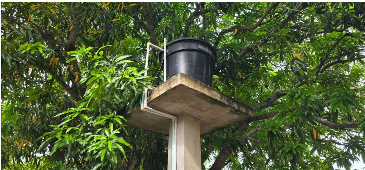
Ilustración 3. Zona de almacenamiento de agua y sistema de Bombeo.