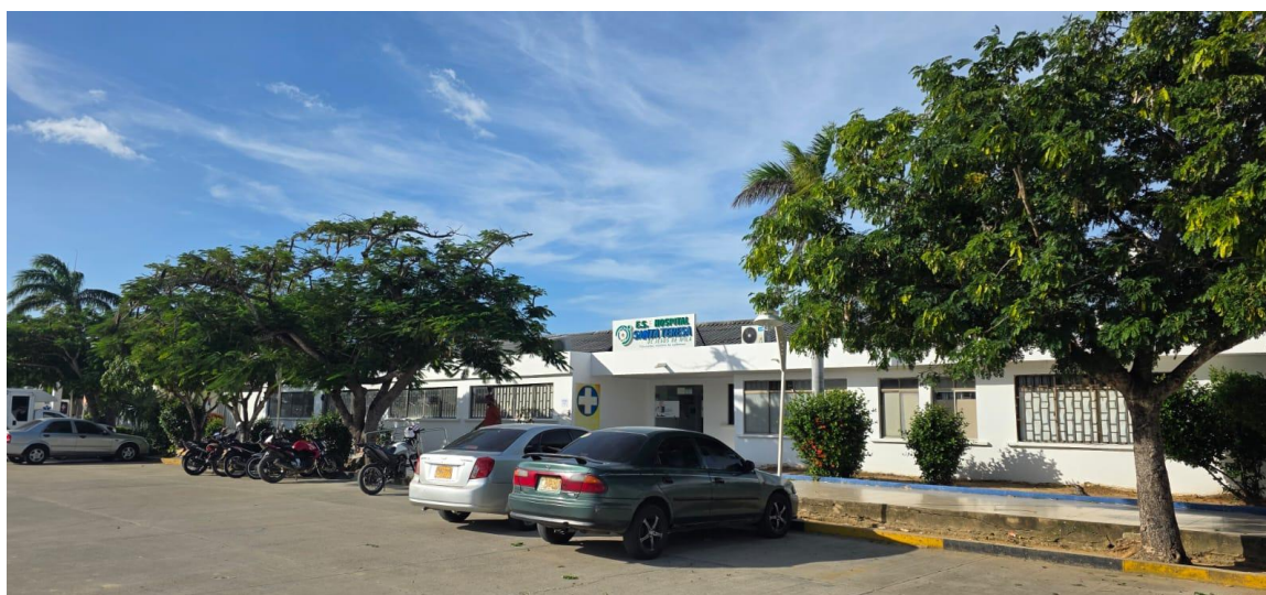
Ilustración 2. Fachada E.S.E Hospital Santa Teresa De Jesus De Avila -Dibulla

El hospital opera 24 horas, presta servicios de IPS (atención primaria y urgencias) y recibe en promedio 394 usuarios diarios. Las atenciones más frecuentes corresponden a enfermedades respiratorias, dengue y desnutrición.