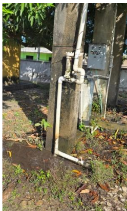
Ilustración 10. Sistema de redes existente (Imagen de referencia)