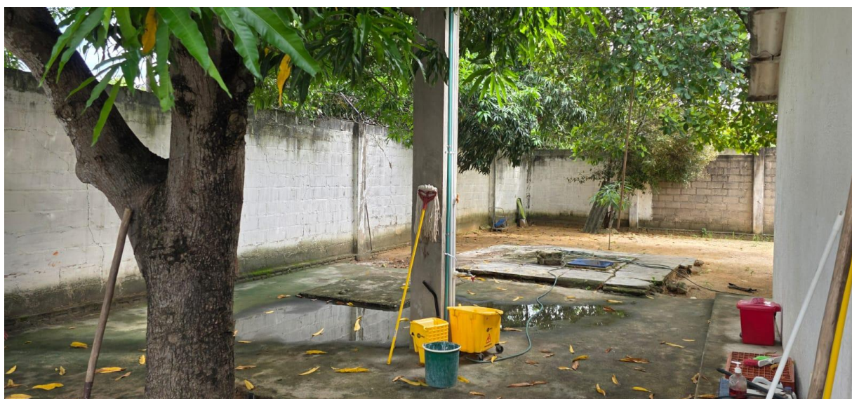
Ilustración 8. Zona de desarrollo de murales

Los murales serán en la zona externa de la alberca nueva, muros laterales y superior, y en caso de las baterías externas será en muro entre las puertas metálicas y bajo las ventanas existentes (los murales resaltarán mensajes claves de agua, saneamiento e higiene, concertados con la comunidad e institución)