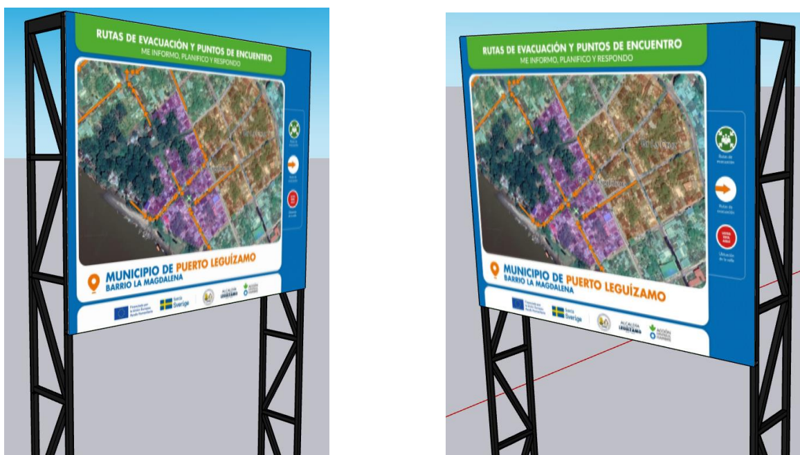
Figura 4. Modelo de la valla requerida.

NOTA. Se comparte el arte de 1 de las 13 vallas requeridas para la realización de las cotizaciones pertinentes, aclarando que, cambia únicamente la zona para evacuar y se mantiene la misma estructura, una vez adjudicado el contrato se compartirá el arte correspondiente para cada valla.