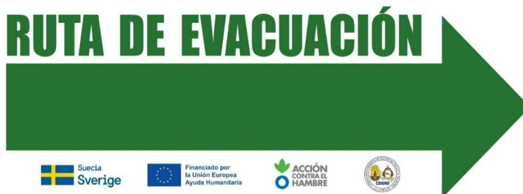
Figura 2. Señalización ruta de evacuación derecha